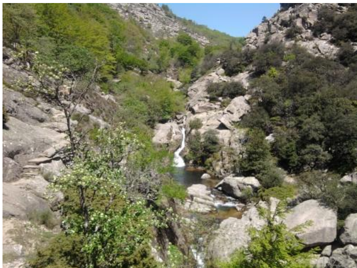
Cascade entre le Madale et le Carroux