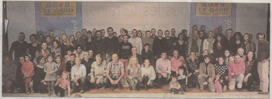
■ La photo de famille des participants à cette cérémonie organisée à l'Auditorium du Département.